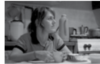
JAZMINES EN LÍDICE RUBÉN SIERRA SALLES · VENEZUELA, MEXIQUE