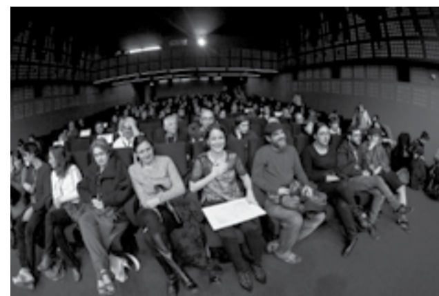
Soirée de remise des Prix de la Compétition Documentaire

287 bénévoles de 15 nationalités différentes (française, espagnole, colombienne, mexicaine, argentine, chilienne, équatorienne, brésilienne, péruvienne, italienne, bolivienne, belge, danoise, étatsunienne, portugaise) qui ont fait vivre le festival.