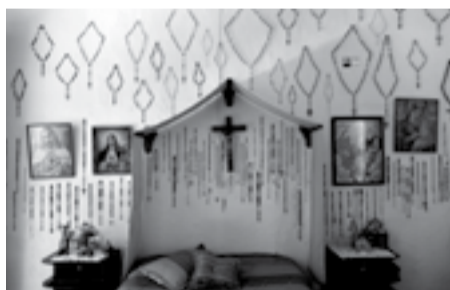
JERICÓ, EL INFINITO VUELO DE LOS DÍAS CATALINA MESA · COLOMBIE 2016

PRIX DOCUMENTAIRE Rencontres de toulouse