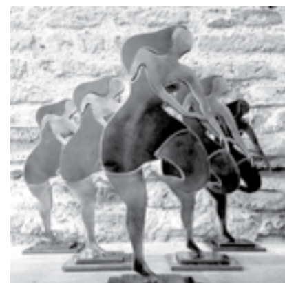
La « Linda », trophée Cinélatino 2017