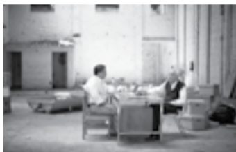
EL AGENTE TOPO MAITÉ ALBERDI · CHILI