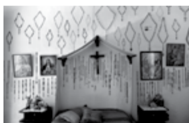
JERICÓ, EL INFINITO VUELO DE LOS DÍAS CATALINA MESA · COLOMBIE 2016

« Un film qui nous paraît être dans l'esprit Cinélatino, qui offre un regard particulier sur des personnages remarquables, représentatifs d'une communauté. »