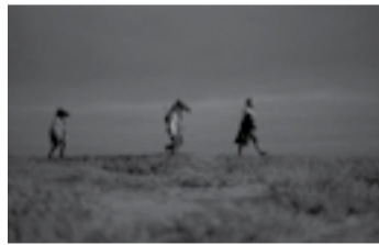
REY NILES ATALLAH CHILI, FRANCE, ALLEMAGNE, PAYS-BAS 2017

PRIX DÉCOUVERTE de la critique française