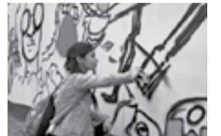
Vane MG dans la cour de la Cinémathèque