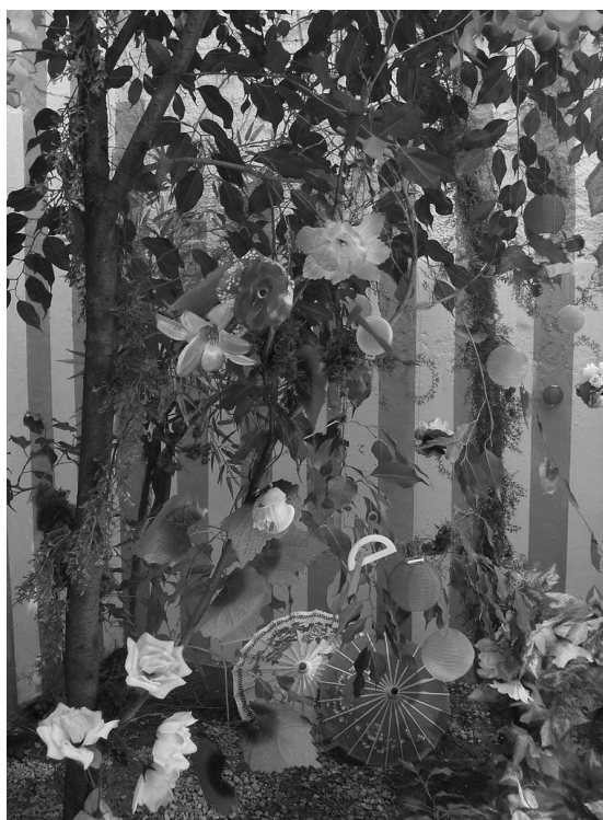
Visibles (programme TV)

cer para poder desmontar sus piezas y volver a ensamblarlas en otro orden o sin ninguno, tal como mi hijo hace con sus rompecabezas.