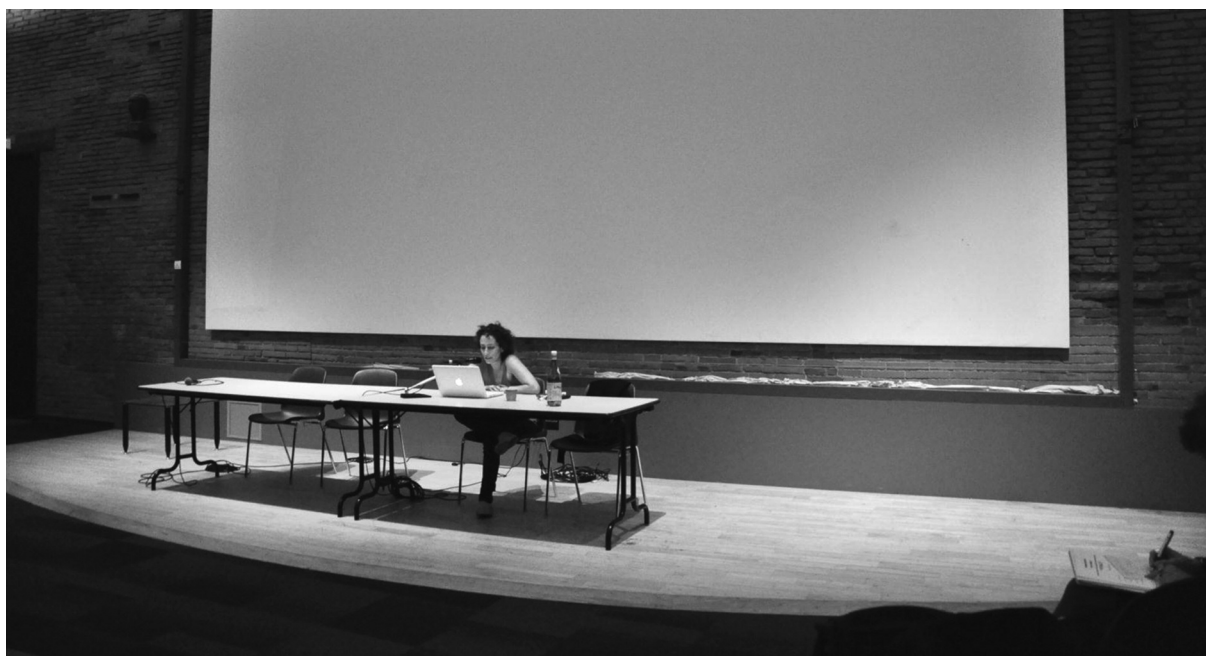
Albertina Carri durante la conferencia del 30 de marzo de 2012, sala Sénéchal en Toulouse, coloquio internacional "De cierta manera", Identités plurielles et normes de genre dans les cinémas latino-américains .

Albertina Carri, pendant la conférence du 30 mars 2012, salle du Sénéchal à Toulouse, colloque international "De cierta manera", Identités plurielles et normes de genre dans les cinémas latino-américains .