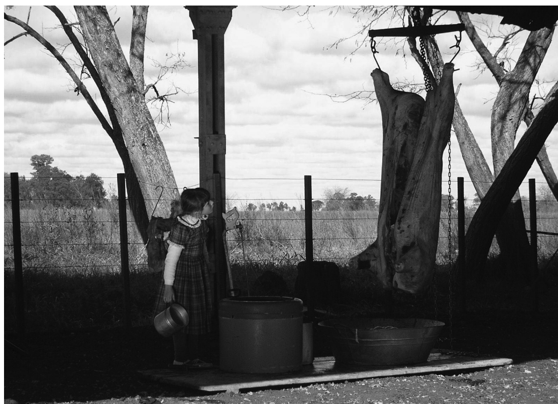
La Rabia, 2008

natural desaparezca, champús que no sólo detienen la caída del cabello o conservan el color sino que además te convierten en otra persona. Cada producto tiene la receta mágica para sacarnos de nuestra insatisfacción permanente en la que nos subsumen los programas financiados por esos mismos productos que nos salvarán de nosotros mismos.