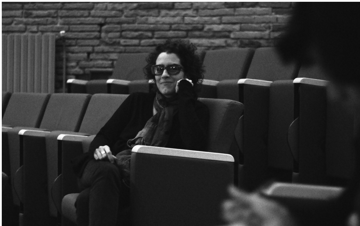
Albertina Carri en Toulouse le 30 de marzo de 2012, sala Sénéchal. Albertina Carri, à Toulouse le 30 mars 2012, salle du Sénéchal.

MOTS-CLÉS télévision – cinéma – image – genre – corps – domestication des femmes – discrimination – résister – mass média