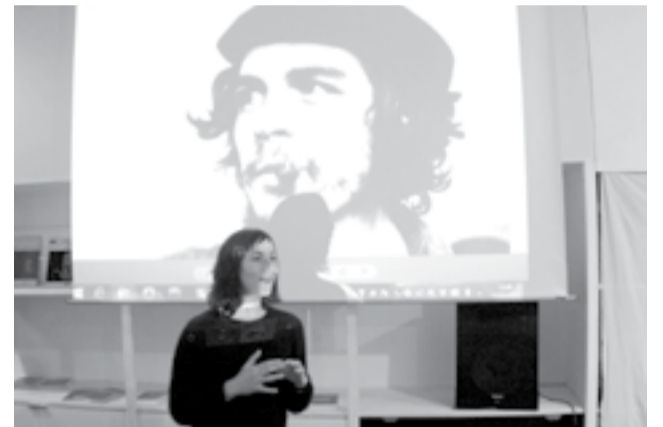
Musicophages: Figures emblématiques d'Amérique latine d'hier et d'aujourd'hui