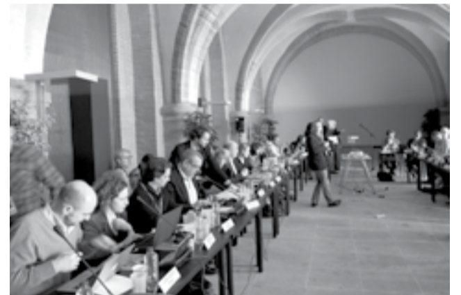
Rencontre des centres nationaux et instituts de cinéma d'Amérique latine et d'Europe