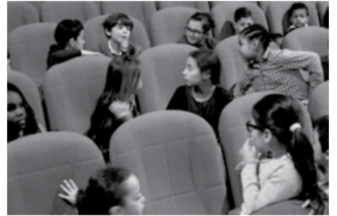
Prix du court-métrage des écoles primaires