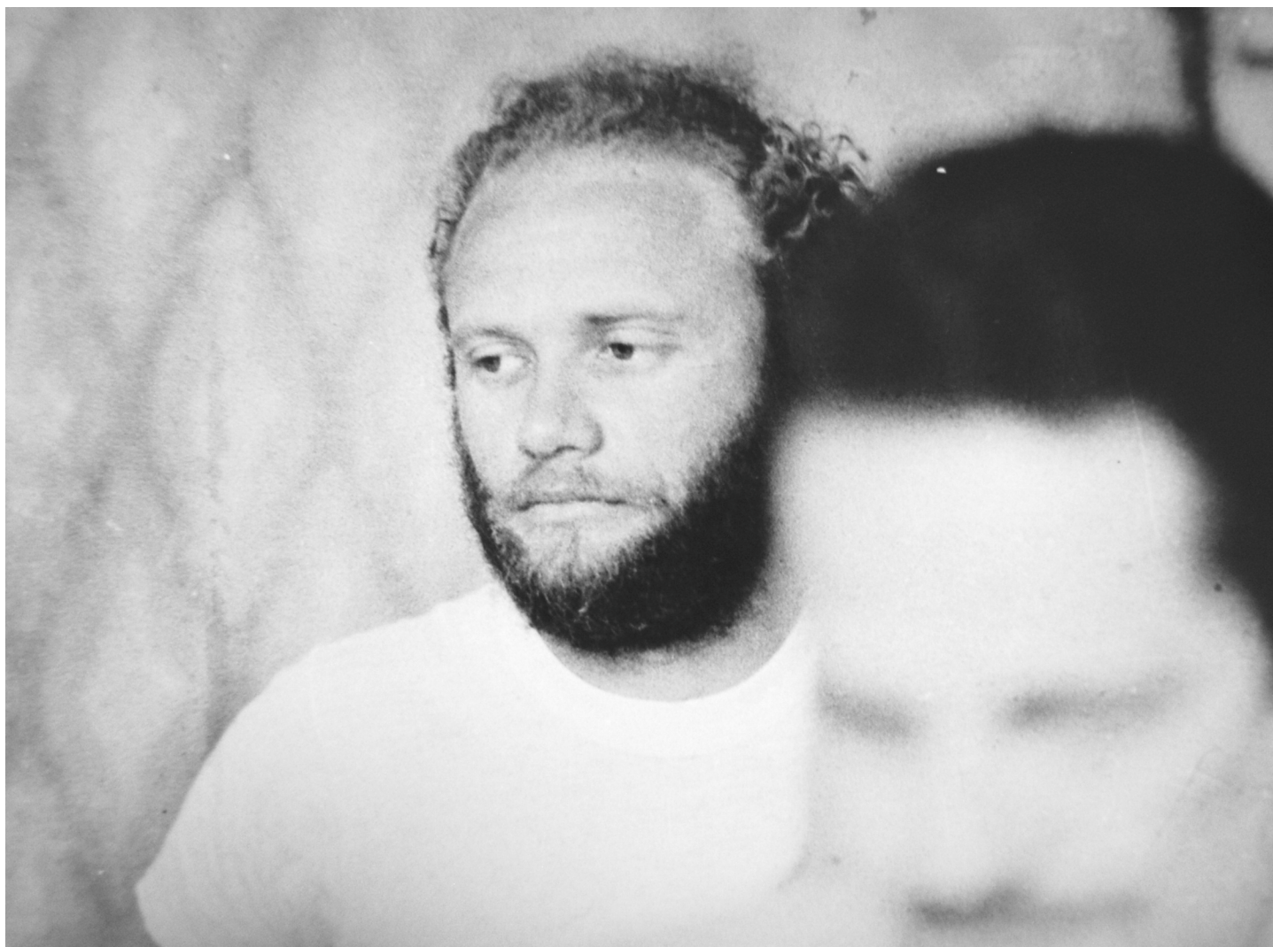
Leon Hirszman (Cuba, 1981)

politicamente afirmativo, de projeção otimista sobre a classe popular, o filme tornava-se a representação das profundas crises de um país que por anos foi submetido à ditadura. Desestabilizando a fragilidade romântica anterior, o cineasta inseriu em sua adaptação a presença da violência e da morte. No longa-metragem, em que a greve é derrotada pela repressão, a morte é um dado sensível para a leitura do Brasil. No tecido dramático, Hirszman insere assassinatos inexistentes na peça: o de um jovem assaltante, menor de dezoito anos, morto brutalmente pela polícia; o do pai de Maria, a noiva de Tião, que é baleado por um bandido; e o mais significativo, o do militante comunista Bráulio, melhor amigo de Otávio, cuja morte é praticamente o símbolo de uma velha esquerda em vias de desaparecimento. Embora o cineasta não abandone certo viés idealista que atravessa toda a sua cinematografia, e que o faz terminar Black-tie com uma passeata pública na qual ouvem-se os gritos de “a greve continua”, fato é que seu filme ficcional, na contramão do documentário ABC da greve , instala um olhar mais apreensivo sobre o país.