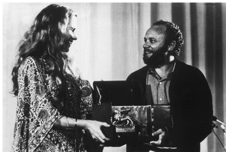
Remise du Lion d'or à Venise en 1981 à Leon Hirszman par Liv Ullmann, présidente du jury, pour son film Eles não usam black-tie .

O pós-1964 configurou-se para o Cinema Novo como um tempo de crise. A partir da implantação da ditadura, tornada mais aguda em dezembro de 1968, a esquerda viveu um processo de intenso desmantelamento que atingiu diretamente o PCB. O recuo do idealismo revolucionário que atravessara os filmes cinemanovistas anteriores a 1964 foi sentido na realização artística de Leon Hirszman. De início, o cineasta pareceu compartilhar de um sentimento agônico geracional que se encontra na essência de obras como O desafio (1964), de Paulo César Saraceni, A grande cidade (1966), de Cacá Diegues, e principalmente Terra em transe (1967), de Glauber Rocha. Em 1967, Hirszman dirigiu Garota de Ipanema , filme no qual a imagem romântica da mulher brasileira, internacionalizada pela Bossa Nova, torna-se melancólica e é colocada diante do mal-estar de seu tempo histórico; e, em 1972, realizou S. Bernardo , adaptação do livro homônimo de Graciliano Ramos sobre as amarguras de um latifundiário embrutecido pelos mecanismos de reificação.