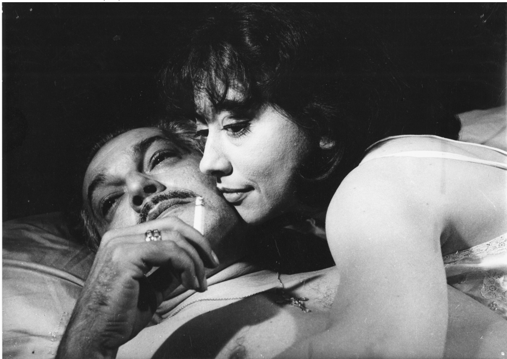
A Falecida (1965)

classe ouvriera como principal protagonista d'un futur processus révolutionnaire de rupture politique. Écrite sous l'influence de ce présupposé idéologique, présent dans l'imaginaire de gauche avant 1964, la pièce est centrée autour d'une confrontation dramatique au sein d'une famille ouvrière : il y a d'un côté le père, Otávio, dirigeant syndical d'obédience communiste ; et de l'autre, son fils, Tião, un jeune homme individualiste qui place ses perspectives d'ascension sociale avant la lutte collective du peuple. Au moment où éclate la grève, la scission symbolique entre les deux devient irréversible. Tião boycotte la grève d'autant que sa copine est enceinte et qu'il a peur de perdre son travail. Otávio, quant à lui, après avoir été arrêté par la police et avoir découvert que son fils avait trahi la grève, décide de le chasser de la maison, dans l'espoir qu'un jour le jeune homme accède à une prise de conscience idéologique et renoue des liens avec sa communauté. Bien que nous nous trouvions devant une fracture d'ordre familial, le grand vainqueur de la pièce est le mouvement ouvrier. Avec une telle fin, Guarnieri avait écrit un récit exemplaire dans lequel le sacrifice personnel, d'ordre affectif, du père faisait partie d'une représentation romantique d'une classe qui, pensait-on,