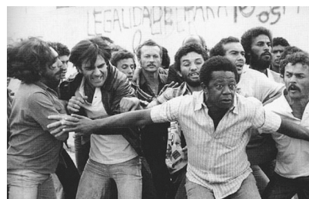
Eles não usam black-tie (1981)