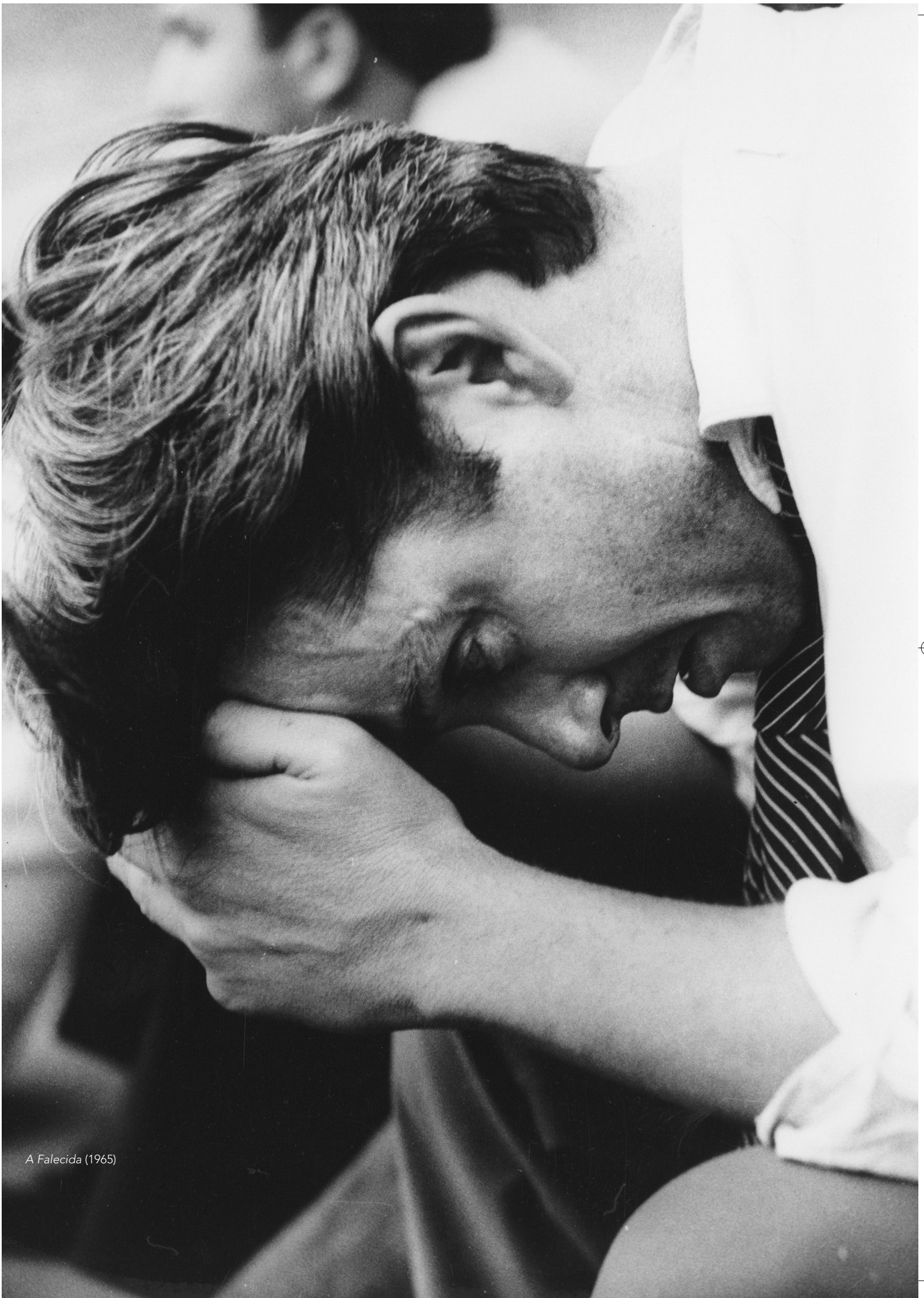
A Falecida (1965)