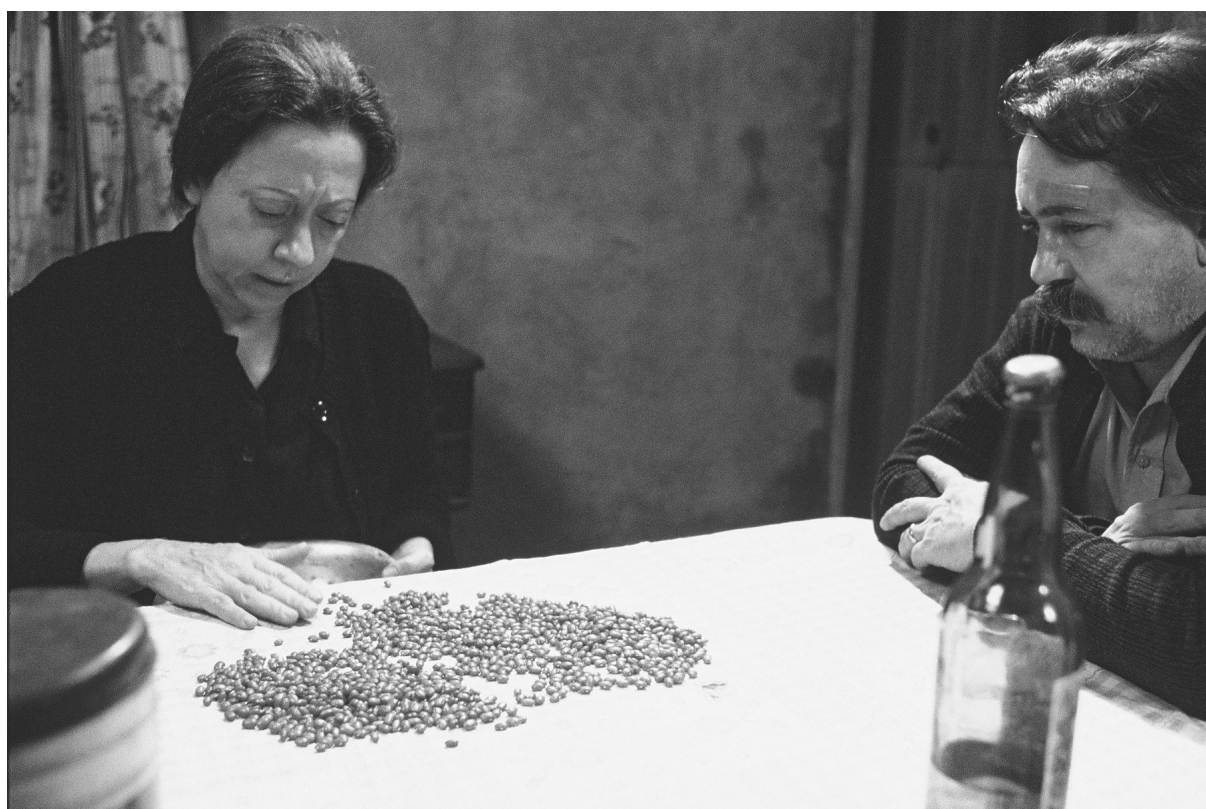
Eles não usam black-tie (1981)

grupo, a mobilização central do sindicalismo não se encontrava em reivindicações trabalhistas, mas sim na questão política ampla, estrutural, de derrubada dos militares do poder.