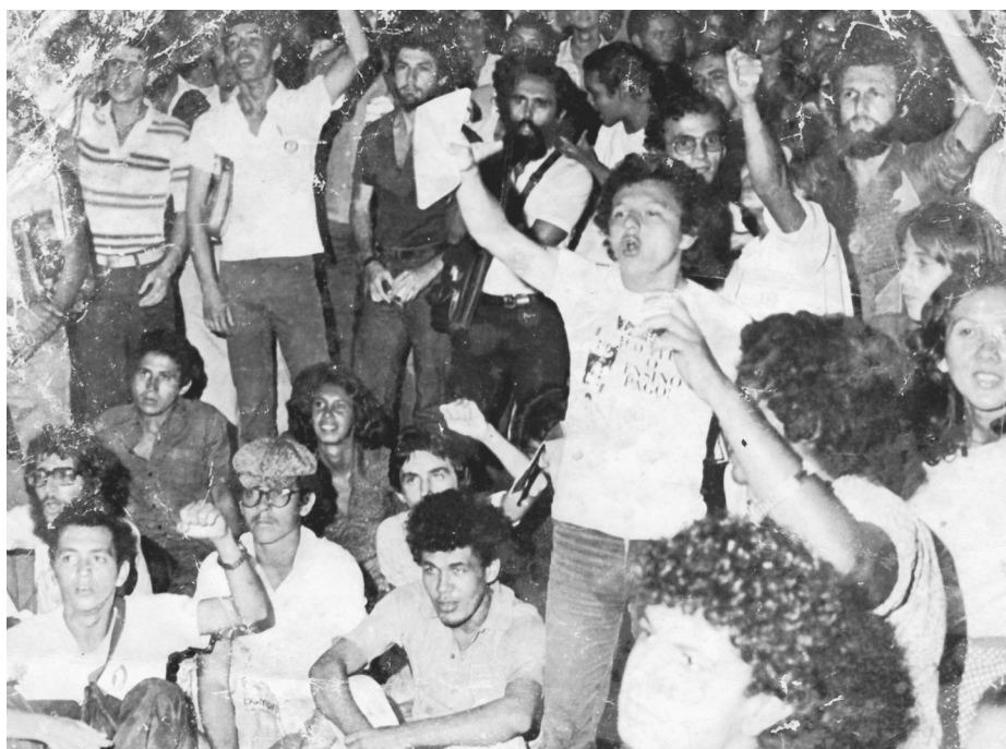
ABC da greve (1979)