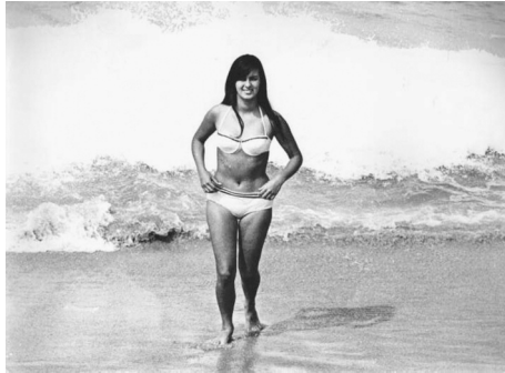
Garôta de Ipanema, 1967

História em movimento, leitura que rapidamente envelheceu diante das profundas fissuras e transformações políticas, o motivo que levou Hirszman, após a montagem de ABC da greve , a não finalizar e exibir o seu documentário? O filme, que permaneceria esquecido, acabou lançado apenas em 1991, quatro anos após a morte do cineasta, já completamente despido do desejo inicial de práxis , transformando-se de instrumento político em documento histórico. A obstinação romântica de Hirszman em torno da redemocratização, inscrita na narrativa de ABC da greve , seria, no entanto, reavaliada por ele no projeto de Eles não usam black-tie .